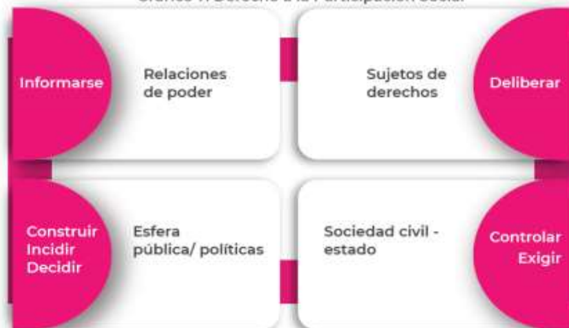
Gráfico 7: Derecho a la Participación Social

En el marco normativo la promulgación de la Ley Estatutaria 1751 de 2015, es un hito pues establece expresamente que la salud es un derecho autónomo fundamental y dispone en su artículo 12, que “el derecho fundamental a la salud, comprende el derecho de las personas a participar en las decisiones adoptadas por los agentes del sistema de salud que la afectan o interesan” y definió el alcance de la participación de forma taxativa: